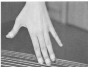
错误手形 图4 手直立 中关节直立