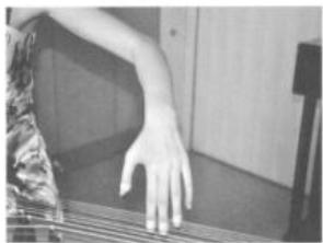
错误手形 图3 肘关节过高，手腕过高